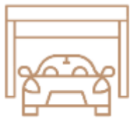
Planta semisótano ampliada y diseñada para diferentes usos