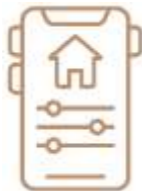
Domótica y seguridad