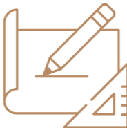
Modificación de la distribución